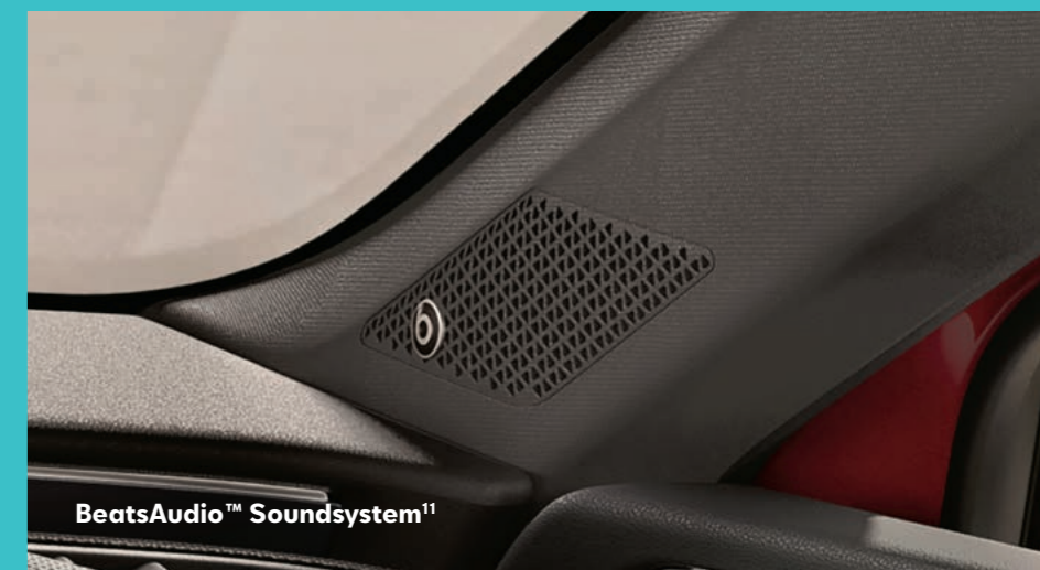
BeatsAudio™ Soundsystem 11