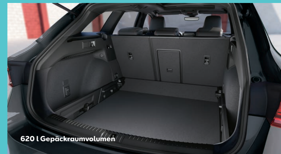
620 l Gepäckraumvolumen