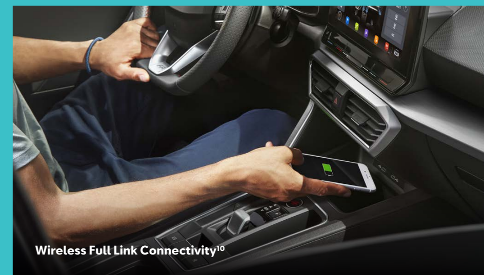
Wireless Full Link Connectivity 10