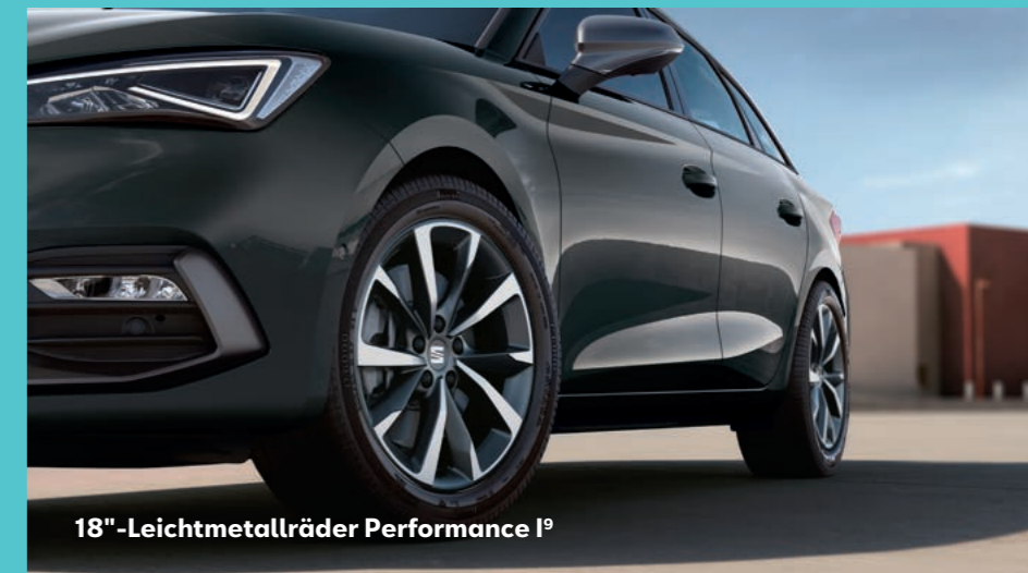
18"-Leichtmetallräder Performance I 9