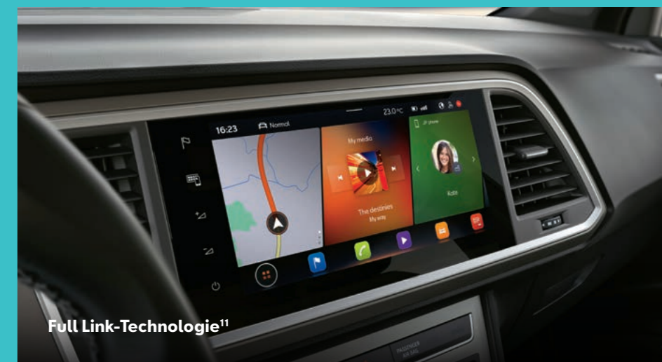
Full Link-Technologie 11