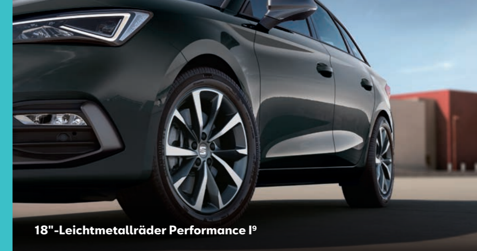
18"-Leichtmetallräder Performance I 9

CO 2 -Emissionen Benziner 6,7 : kombiniert 137–124 g/km Diesel 6,8 : kombiniert 126–112 g/km