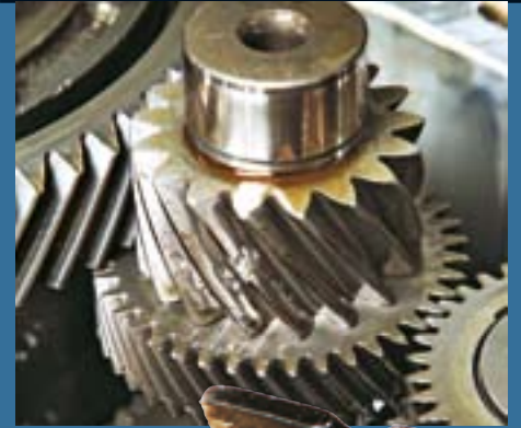
Heißer Bruch: Die Schäden an diesem Zahnrad wurden durch ein Bruchstück (mittl. Foto) von der Schaltbetätigung verursacht. Magneten sammelten die Späne (rechts)