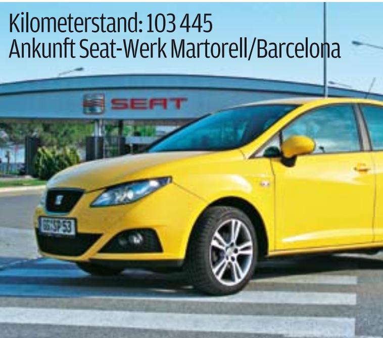
Geschafft: Ein letztes Foto, dann geht es ab zur Zerlegung im Seat-Werk