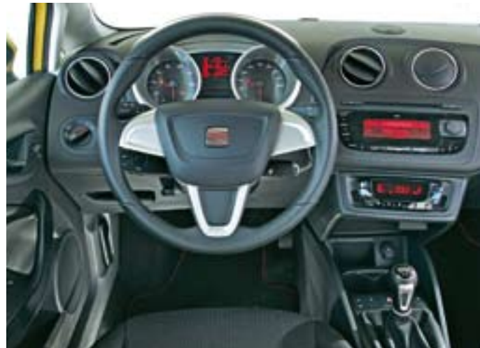
Jugend forscht: Flottes Cockpit, ältere Semester haben Probleme mit den kleinen Ziffern. Am häufigsten wurde die billige Materialanmutung und das unlogische Radio kritisiert. „Das ist einfach nur doof“, notiert ein Kollege