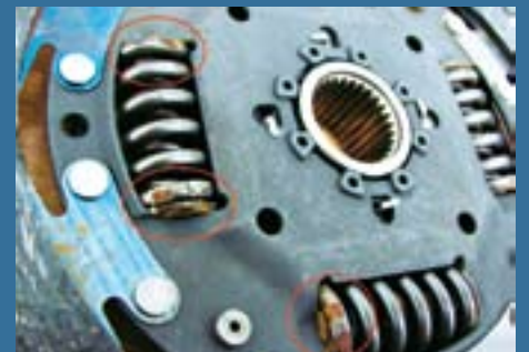
Heiß geschaltet: Die Torsionsfedern der Kuppelungs-Mitnehmerscheibe sind eingearbeitet