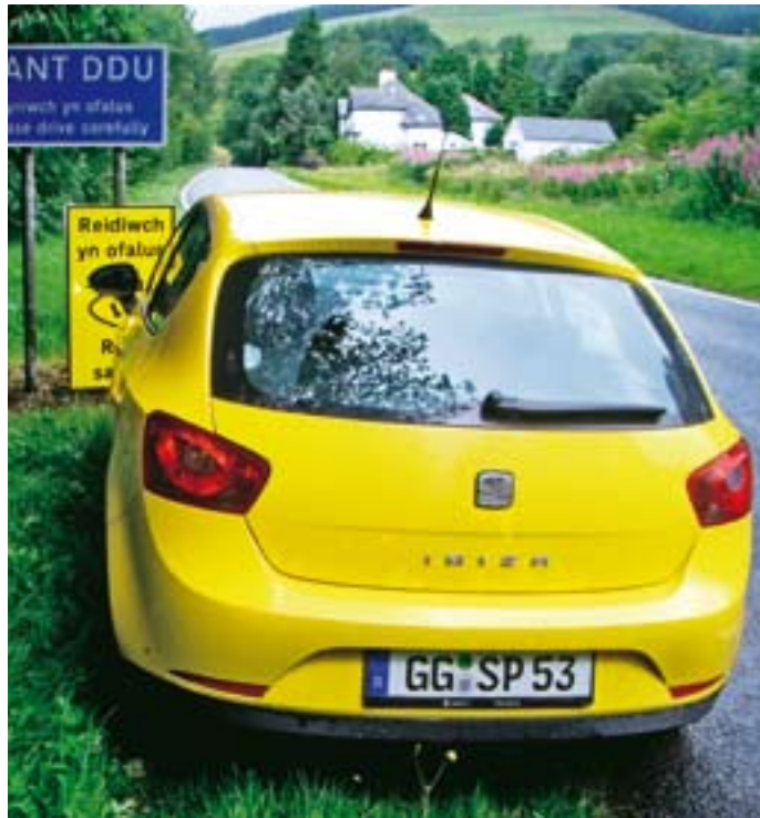
Besuch in Wales: Der Reisende lobt Sitze („super Seitenhalt“) und Lenkung („schön direkt“). Die schlechte Sicht nach schräg hinten nervt ihn

■ Mein Dreizylinder-Ibiza ist mit 5,5 bis 6 Litern zufrieden. Nur bei Vollast säuft er wie ein Sechszylinder. Die Verarbeitung gibt keinen Grund zur Klage. Lars Melchin , 31737 Rinteln