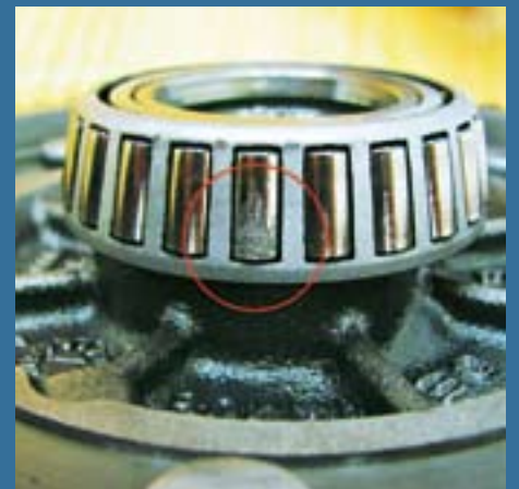
Heiß gelaufen: Dieses Kegelrollenlager des Achsdifferenzials zeigt Materialverschleiß