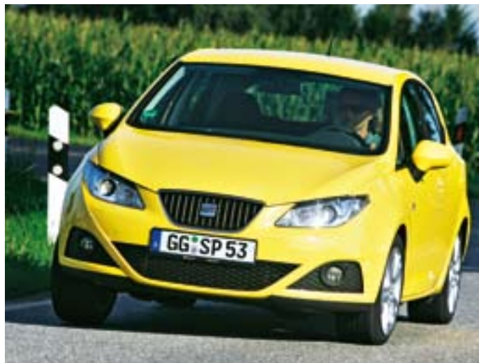
Beste Referenzen: Der Ibiza steht auf der Bodengruppe des aktuellen Polo