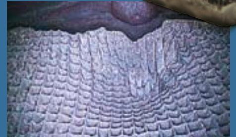
Heiße Stelle: Diese Anschmelzung am Katalysator-Monolith (Eingangsseite) blieb ohne Folgen